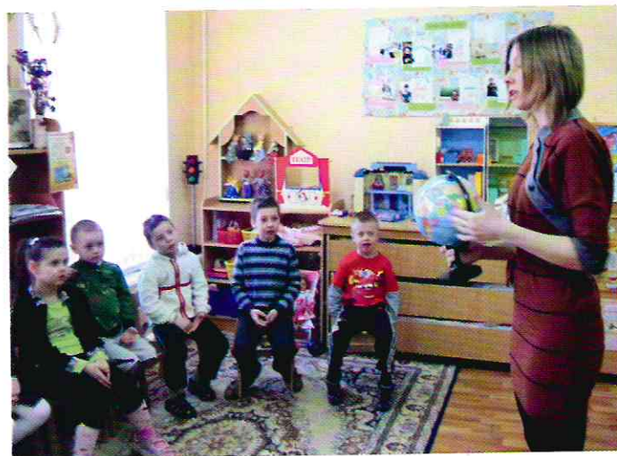
«Клуб путешественников» вместе с мамой