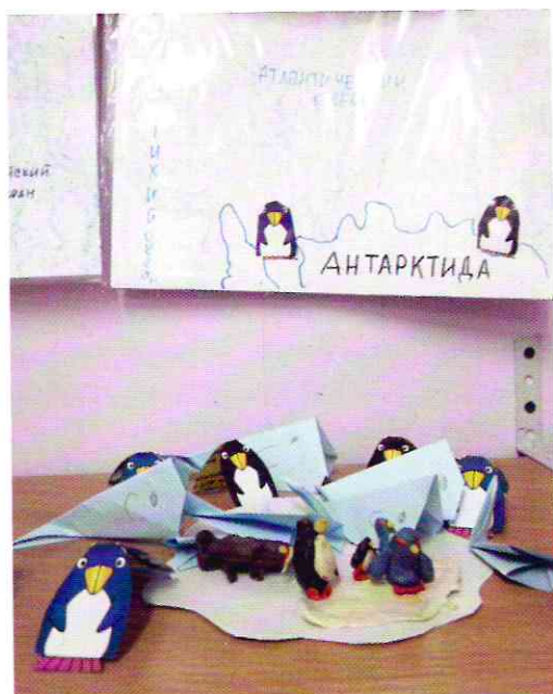
Пингвины – обитатели Антарктиды

Развитие речи : составление сюжетного рассказа «Один день из жизни в Антарктиде»; речевая игра «Назови сколько?» (согласование существительных и числительных).