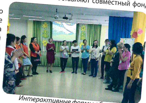
Интерактивные формы обучения (сетевое объединение г.Якутск)

Детские сады г. Якутска (МБДОУ Д/с №14 «Журавлик», МБДОУ Д/с №85 «Золотой ключик», МБДОУ Д/с №40 «Солнышко», МБДОУ Д/с №42 «Мамонтенок», МБДОУ ЦРР Д/с